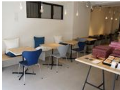
モトスミ・ブレイメン通り店 カフェスペース