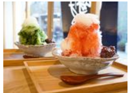
かき氷 抹茶あずき・とちおとめあずき