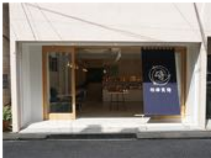
モトスミ・ブレイメン通り店 外観

各コンセプトストアでは、住む人たちが楽しく、便利に毎日過ごせるためという思いで、店舗運営を進めていきます。街への貢献を考えて、松崎煎餅が発信するコンセプトストアをどうぞ注目ください。